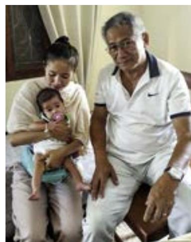
Khounsab 4 mois, 6 mois et 1an

- Au profit des patients adultes atteints de maladies cardio-vasculaires , la Direction du Nouvel Hôpital de l'Amitié de 350 lits dont 40 lits en cardiologie (32 lits de cardiologie tiède, 8 lits de soins intensifs cardiologiques) et le Ministère de la Santé nous ont confié la formation continue et le perfectionnement des médecins du service pour optimiser les consultations pour Adultes et Enfants, la pratique des explorations non invasives avec la mise en place du nouveau plateau technique et le suivi des patients hospitalisés partiellement cadrés.