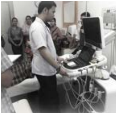
Cardio Hôpital de l'Amitié

En temps normal, j'alterne des missions de 2 mois 3 fois par an. La pandémie m'a tenu loin de ma famille et de la France durant 6 mois.