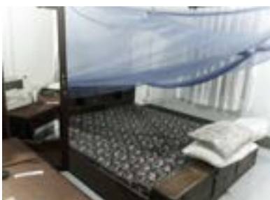
Confinement au centre

« Guérir parfois, soulager souvent, écouter toujours. » (Louis Pasteur)