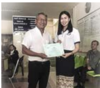
Attestation de formation

Cependant les répercussions indirectes sur les populations défavorisées et les malades nous incitent à déployer de nouveaux efforts pour surmonter cette période difficile et inédite. Plus que jamais, avec votre soutien, il nous faut ne pas oublier la prise en charge des enfants malades.